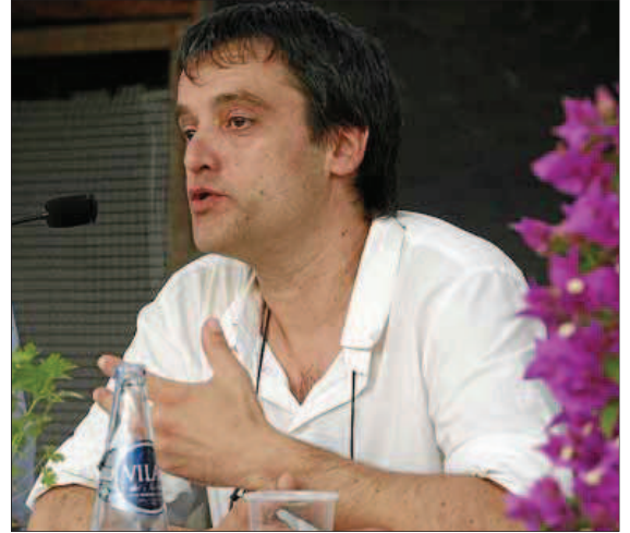
Bagaje. El cocinero profesional señaló que la cocina menorquina es un compendio de diversas influencias lo largo de la historia.

fluencias desde la civilización romana, no únicamente de las dominaciones británicas y francesa del siglo XVIII. «La caldereta es una herencia de la cultura griega y se come en todo el Mediterráneo. Lo que ocurre es que en Menorca se singulariza con el uso de los productos autóctonos», afirmó. Pelfort abogó por el aprovechamiento de los recursos propios de cada época del año y por apostar por una gastronomía identitaria. «Lo sostenible y saludable es la cocina de nuestras abuelas, que está ligada a la longevidad de esta tierra», recalcó. TONI SEGUÍ