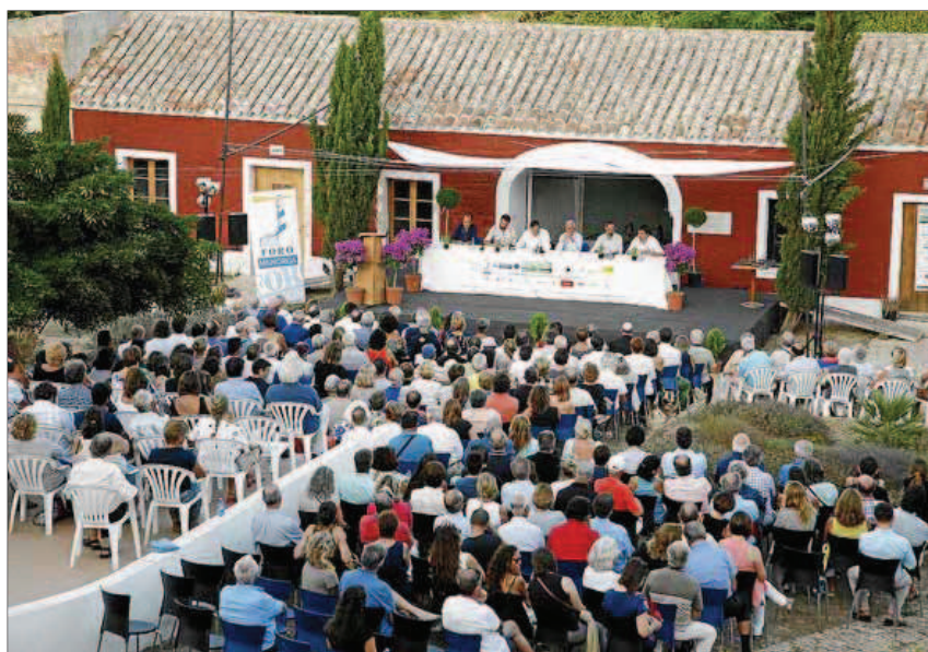
Imagen del patio de la Illa del Rei donde se celebró la octava edición del Foro.