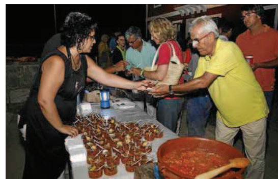
El oliaigua fue cocinado y preparado en Alcaufar Vell.

La novedad del foro celebrado ayer fue la degustación del tradicional plato de oliaigua amb figues , que todos los asistentes al evento -alrededor de 500 personas- pudieron dar buena cuenta al finalizar la parte teórica del acto. La elaboración del oliaigua amb figues fue a cargo de Sa Cooperativa del Camp, la asociación Fra Roger y el hotel rural y restaurante Alcaufar Vell y su degustación colaboraron Coinga, Coca-Cola, El Buen Corte y los voluntarios de la Illa del Rei. Al final del acto, todos los asistentes fueron obsequiados con una caja de queso fundido «Flor de s'Illa», de Quesería Menorquina, y un queso de la marca «Meloussa», de Sa Cooperativa del Camp de Menorca. Por otra parte, asistieron al foro